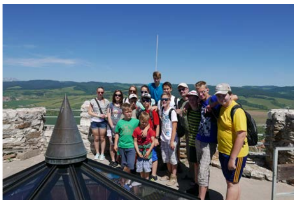
Miništranti a lektorky na výlete