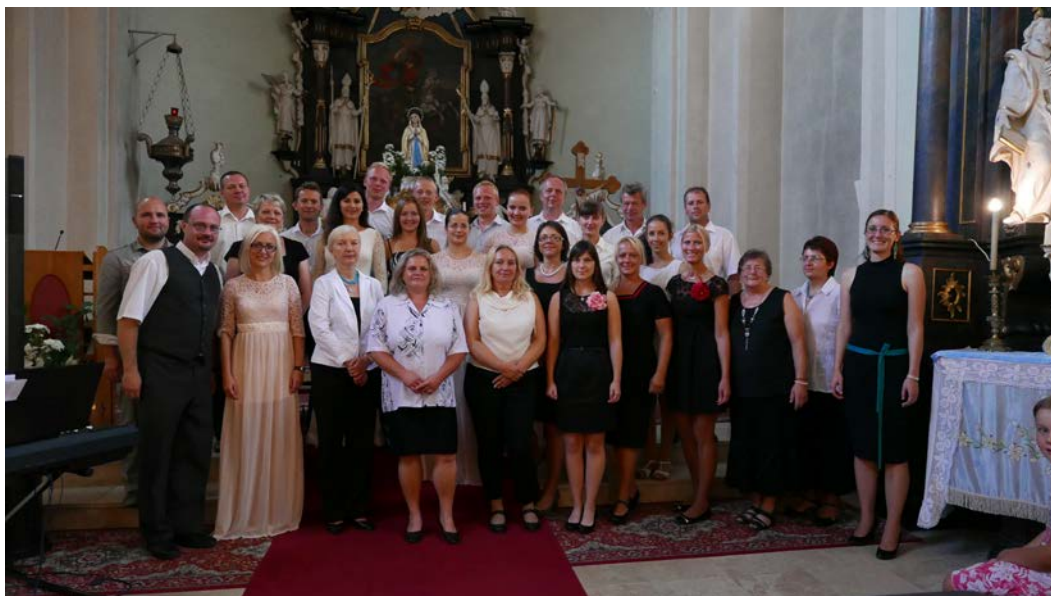
La Speranza a spevokol z Bobrovca