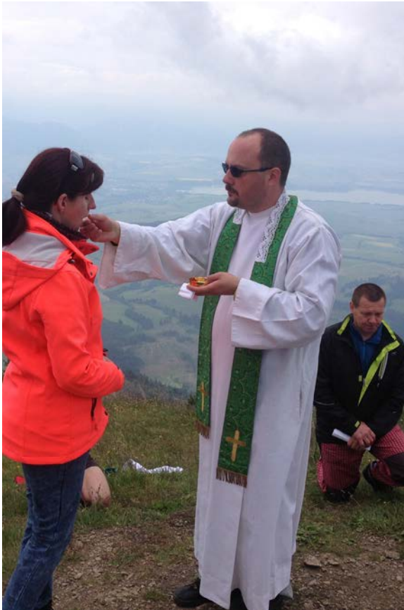
Sväté prijímanie počas slávenia svätej omše na Babkách

Aj napriek chladnému počasiu cez týždeň a nie veľmi priaznivej predpovedi sme sa 27. júna 2015 stretli pred kaplnkou Sedembolestnej Panny Márie, aby sme spoločne vystúpili na Babky (1566 m n. m).