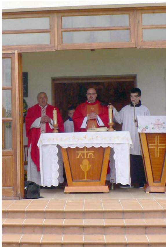
Svätá omša na Vápenici